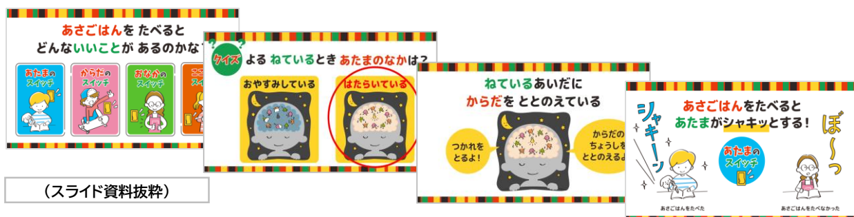
(スライド資料抜粋)